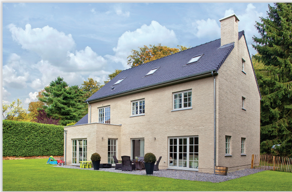
Cegły i płytki ręcznie formowane – 43 Argentis. Zastosowanie: elewacje wszelkiego rodzaju budynków, elementy dekoracyjne we wnętrzach, ogrodzenia i mała architektura.