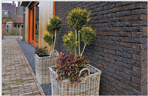
Cegły i płytki ręcznie formowane – 97 Robusta format Zero. Zastosowanie: elewacje wszelkiego rodzaju budynków, elementy dekoracyjne we wnętrzach, ogrodzenia i mała architektura.