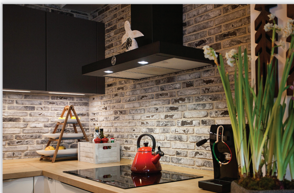
Cegły i płytki ręcznie formowane – 360 Rainbow Snowdust. Zastosowanie: elewacje wszelkiego rodzaju budynków, elementy dekoracyjne we wnętrzach, ogrodzenia i mała architektura.