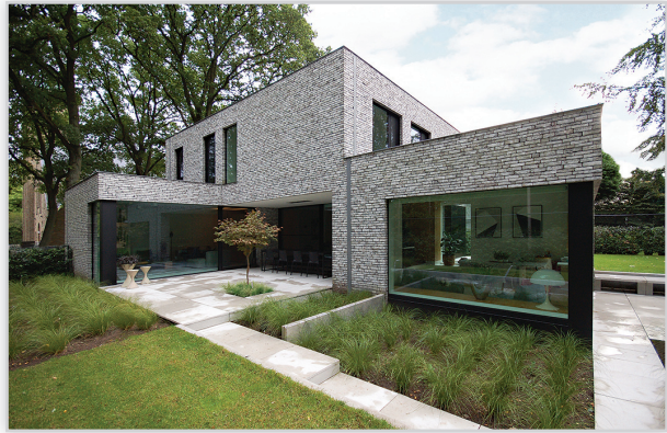
Cegły i płytki ręcznie formowane – 360 Rainbow Snowdust. Zastosowanie: elewacje wszelkiego rodzaju budynków, elementy dekoracyjne we wnętrzach, ogrodzenia i mała architektura.