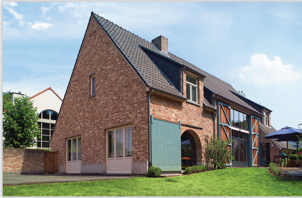
Cegły i płytki ręcznie formowane – 40 Oud Maasland. Zastosowanie: elewacje wszelkiego rodzaju budynków, elementy dekoracyjne we wnętrzach, ogrodzenia i mała architektura.